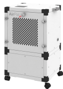
AirPal Go 300 H